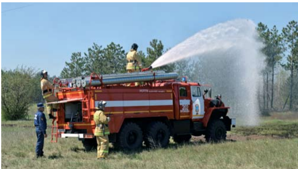
Противопожарные учения, проходившие в Усть-Донецком районе в апреле 2014 года. Работники пожарной части №202 Белокалитвинского района.

Беседовала Ирина Астапенко