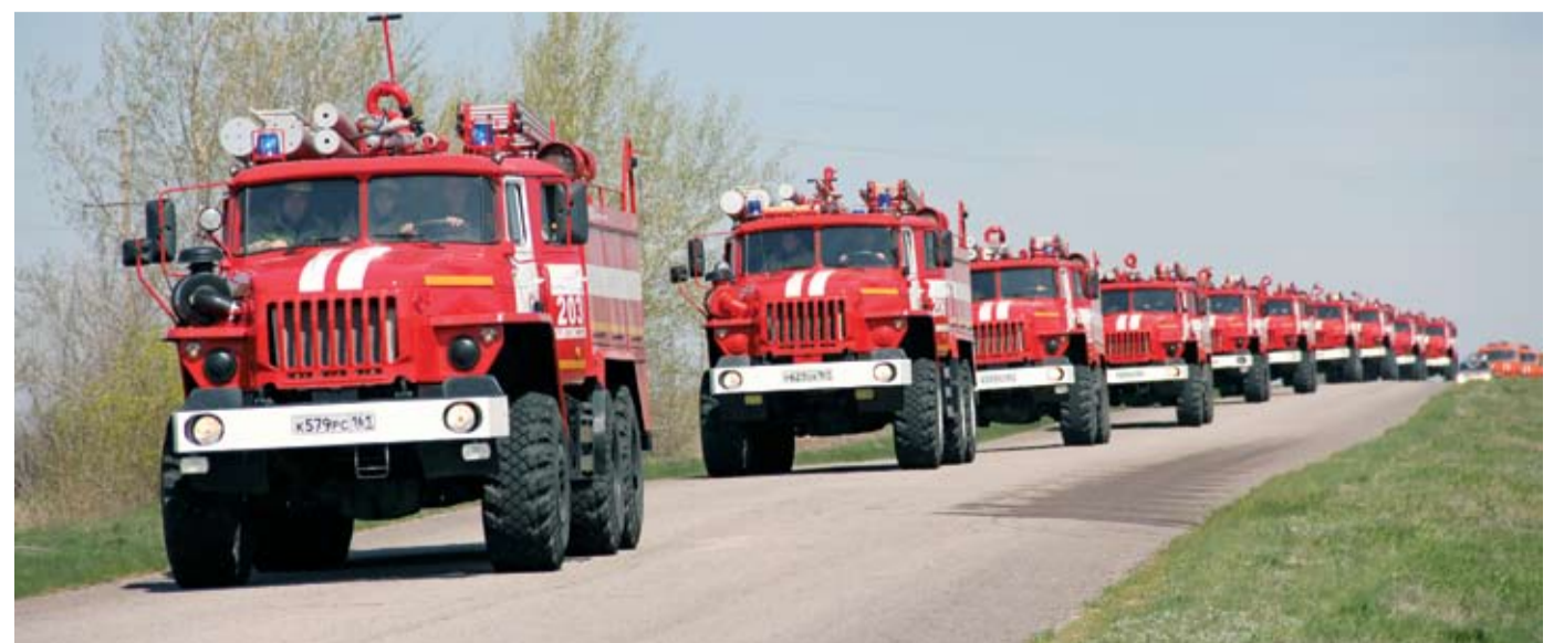
Противопожарные учения, проходившие в Шолоховском районе в апреле 2013 года. Пожарные автомобили УРАЛ.

– На сто процентов. На самом деле наша служба на сегодняшний день полностью укомплектована всей необходимой для тушения пожаров новой техникой отечественного производства. В распоряжении каждой части по два автомобиля. Этого вполне достаточно, чтобы оперативно и качественно